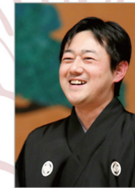
能楽師狂言方 善竹 隆司

能楽師・大坂流狂言方。重要無形文化財保持者。二世善竹忠一郎の長男、故人間国宝・善竹彌五郎の曾孫にあたる。「善竹兄弟狂言会」を弟・隆平とともに主催。兵庫県芸術奨励賞、平成23年度「大阪文化祭賞」受賞。大阪市から「咲くやこの花賞」受賞。